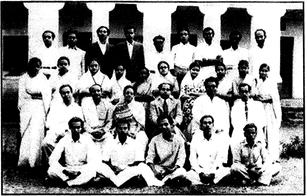
ছবিতে ঢাকা বিশ্ববিদ্যালয় বাংলা বিভাগের এম.এ শেষ পর্বের ছাত্রছাত্রীবৃন্দ, ১৯৫৯ ও অধ্যাপকবৃন্দ।